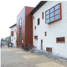
Nootdorp grootse kleinschaligheid

Architectuur moet mooi zijn, maar ook slim en functioneel, stellen Sven Vonk en Martine van der Heijden , architecten van Nibag. 'In onze ontwerpen zoeken we altijd naar de goede verhouding tussen functionaliteit en esthetica. Een gebouw moet passen als een jas en gebruikers moeten er met plezier hun werk kunnen doen.'