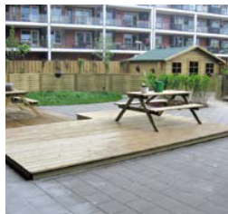
Woeste Willem buiten gewoon natuurlijk